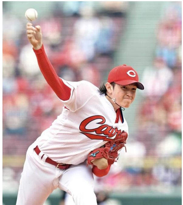
プロ入り後は TAO ネットレス AURA を使用

大道選手は高校時代からコラントツテを愛用されていました。将来プロ野球選手になること、使用しているグラブメーカーのアンバサダーになること、そしてコラントツテの契約選手になることを目標に努力され、高校時代からの夢を果たしました。