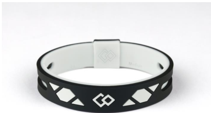
ブラック×ホワイト