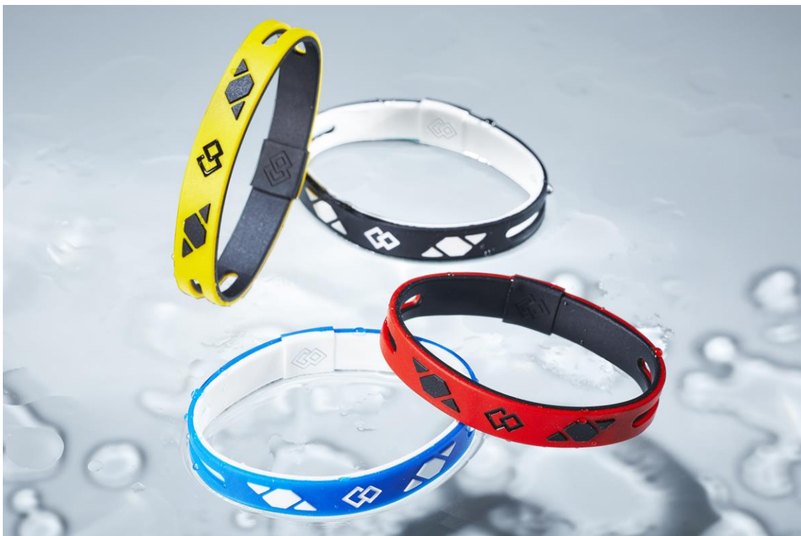
コラントッテ SPORTS アームループ SR140 価格¥4,180/税込

磁気健康ギア「Colantotte (コラントッテ)」の製造・販売元である株式会社コラントッテ(本社:大阪市中央区、代表取締役社長:小松 克己)は、運動しながらボディケアができる腕用磁気アクセサリー「コラントッテ SPORTS アームループ SR140」を2023年6月1日(木)より順次販売いたします。